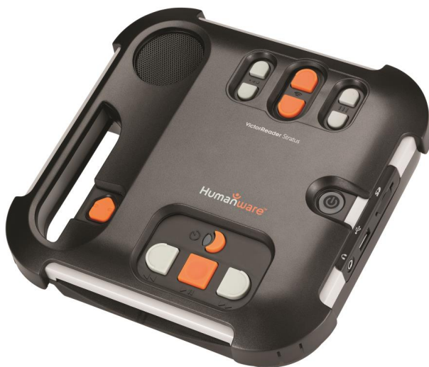
Victor Stratus 12 med överlägg monterat

Vid leverans följer, förutom själva spelaren, eventuellt tangentbordsöverlägget och denna instruktion, följande med: