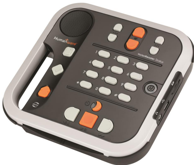
Victor Stratus 12 utan överlägg

När spelaren packas upp kan det sitta ett överlägg av plast på spelaren. Det täcker en del tangenter. Spelaren kan användas med överlägget på men får då lite begränsade funktioner.